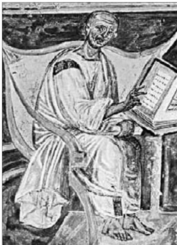
La imagen más antigua de san Agustín (Roma, Laterano, siglo VI)

«Raramente. Por ejemplo, cuando el Cónclave me eligió Papa. Antes de la aceptación pedí poderme retirar por algún minuto en la estancia junto a la del balcón sobre la plaza. Mi cabeza estaba completamente vacía y una gran ansia me había invadido. Para que se pasara y relajarme cerré los ojos y desapareció todo pensamiento, también el de negarme a aceptar el cargo, como por lo de-